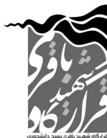
بازگه شهید باقری بسیج دانشجویی

مرکز مطالعات قرارگاه شهید باقری سازمان بسیج دانشجویی آدرس: تهران، خیابان طالقانی، تقاطع مفتح، سازمان بسیج دانشجویی، ساختمان شهید باقری شماره تماس: ۰۲۱-۸۸۳۸۱۵۵۶ سامانه پیامکی: ۶۶۰۰۰۳۵۲ نشانی اینترنتی: q-b.ir